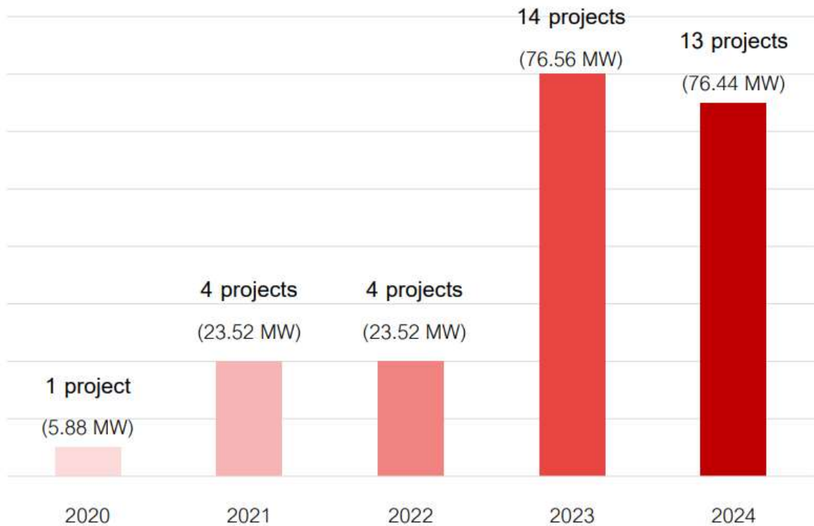
Figure 2: Phase-out of Adder